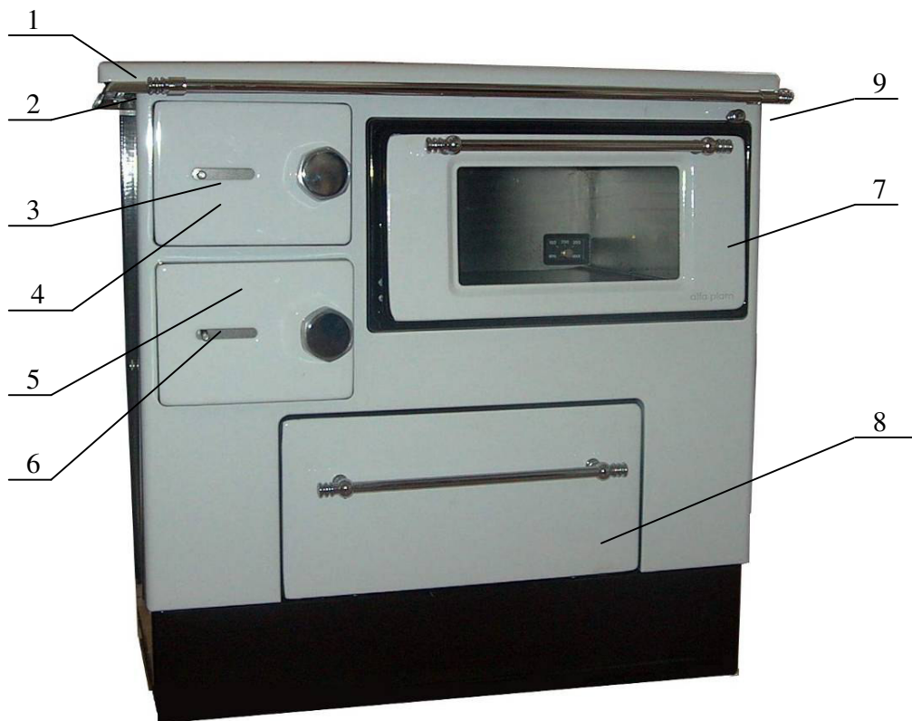
Slika br. 1